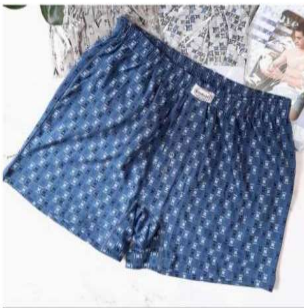
Таблиця чоловічої білизни

Класичні чоловічі труси - боксери сімейного типу для щоденного носіння. Комфортна модель вільного крою середньої посадки. Особливості моделі : труси прямі, злегка звужені на відміну від звичайних сімейних трусів. Ширинка із запахом без фіксуючого гудзику. На поясі з внутрішньої сторони пришта м'яка еластична широка гумка, що не стискає рухів. Спереду пояс прикрашений невеликим пришивним ярличком з логотипом. Плоскі шви унеможливають дискомфорт. Склад : 100% бавовна, що забезпечує доступ повітря до тіла. Властивості тканини - натуральна. Тип тканини : м'який трикотаж. Колір : в різних кольорах. З візерунками (мілкий контрастний малюнок) або принтами. Труси гарної якості - зберігають форму та колір протягом тривалого часу. Розмірний ряд : 44-46 -40 шт., 48-50 - 35 шт., 50-52 - 30 шт., 52-54 -30 шт., 54-56 - 30 шт. Товар відповідає міжнародній розмірній сітці: М (46-48), (48-50), ХІ. (50-52), ХХІ. (54-56), ХХХІ. (56-58).